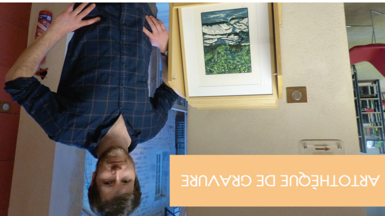
ARTOTHÈQUE DE GRAVURE